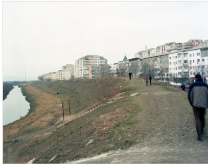
Michele Bressan , Alexandru cel Bun – Iași , print inkjet pe dibond, 62x160 cm, 2012

Dipticul fotografic al lui Michele Bressan este realizat în zona Alexandru cel Bun din Iași, la graniță cu cartierul Dacia, unde, sub pretextul construirii pe malul Râului Bahlui a unor diguri de protecție pentru inundații, care în zona respectivă ar putea să se producă cu o probabilitate setată o dată la o sută de ani, o comunitate ghețozată care trăiește de partea cealaltă a orașului a fost izolată printr-un zid de beton pe care localnicii îl numesc Zidul Plângerii. În ordinea de citire a dipticului panoramic, această mahala, izolată de oraș printr-un zid, constituie o imagine absentă în stânga. Imaginea absentă din dreapta trimite la zona promisă de dezvoltare urbană, cu noi facilități comerciale asociate unei ideale prosperități colective.