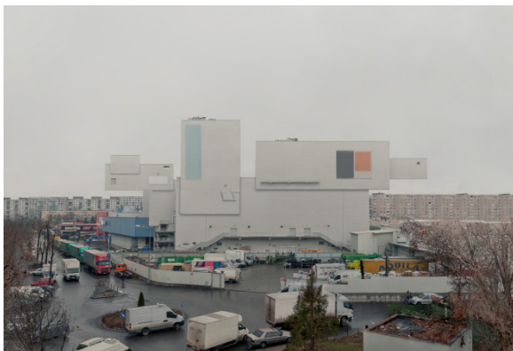
Andrei Mateescu , Untitled , din seria Hyper , 80x117 cm, print pe dibond, 2012

Dipticul fotografic al lui Michele Bressan este realizat în zona Alexandru cel Bun din Iași, la graniță cu cartierul Dacia, unde, sub pretextul construirii pe malul Râului Bahlui a unor diguri de protecție pentru inundații, care în zona respectivă ar putea să se producă cu o probabilitate setată o dată la o sută de ani, o comunitate ghețozată care trăiește de partea cealaltă a orașului a fost izolată printr-un zid de beton pe care localnicii îl numesc Zidul Plângerii. În ordinea de citire a dipticului panoramic, această mahala, izolată de oraș printr-un zid, constituie o imagine absentă în stânga. Imaginea absentă din dreapta trimite la zona promisă de dezvoltare urbană, cu noi facilități comerciale asociate unei ideale prosperități colective.