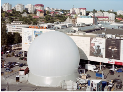
Matei Bejenaru, Iulius Mall Iași, print digigrafic, 143x188 cm, 2010